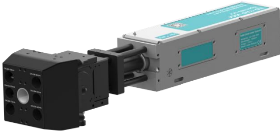
多路激发探测 LIBS 光谱探头

两款探头均具备高灵敏度、高分辨率的特点，无论是微量元素的检测还是复杂样品的分析，都能准确捕捉光谱信息，适用于环境监测、地质勘探等领域。莱森光学 LIBS 光谱探头，以先进的技术和稳定的性能，助力科研与工业应用，为用户的光谱分析提供有力支持。