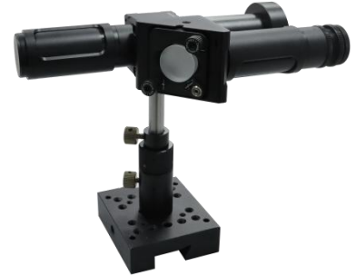
同轴一体式 LIBS 光谱探头

同轴一体式 LIBS 光谱探头的设计集激光发射、光谱收集于一体，结构紧凑，操作简便，适用于快速、精确的元素分析。而多路激发探测 LIBS 光谱探头则拥有多个激光激发通道，能够同时探测多个目标点，大大提高分析效率。